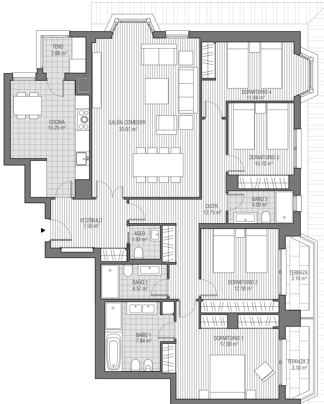
CUADRO DE SUPERFICIES