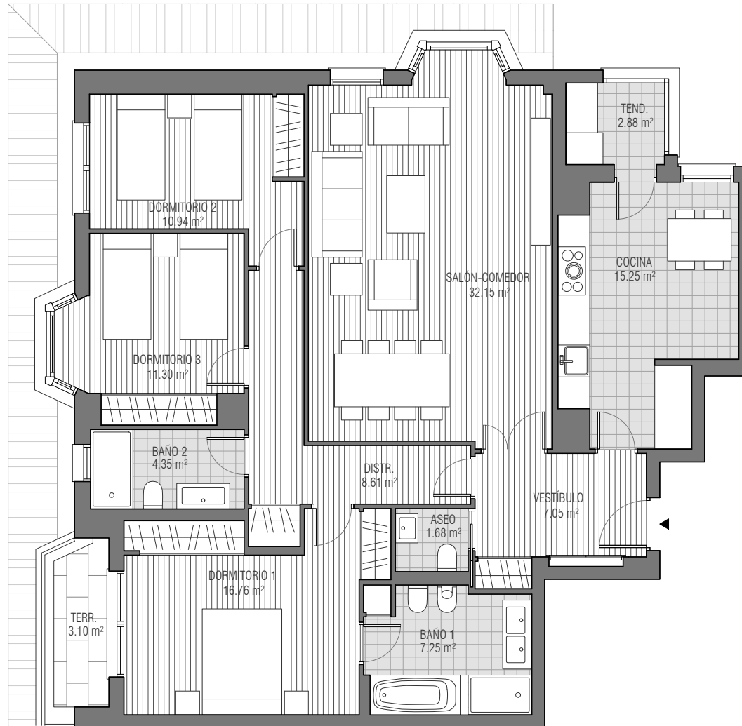
CUADRO DE SUPERFICIES