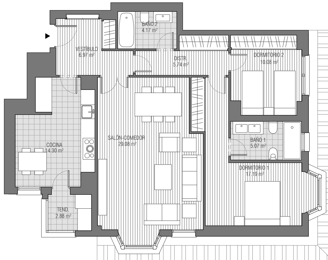
CUADRO DE SUPERFICIES