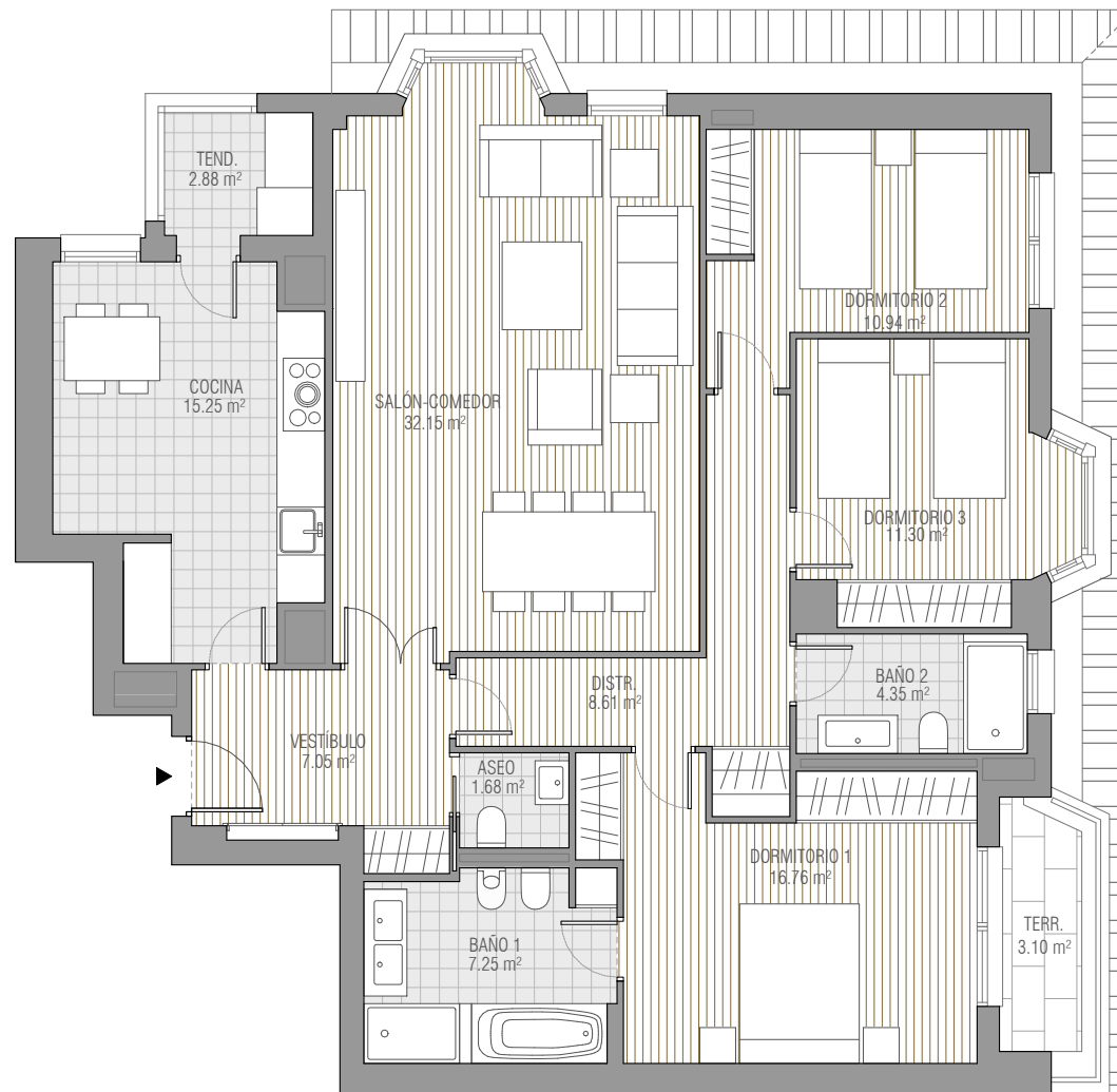
CUADRO DE SUPERFICIES