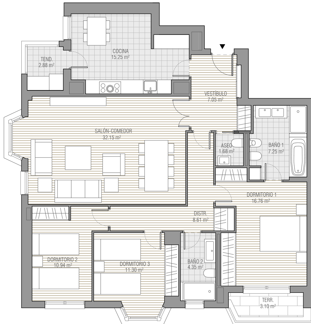
CUADRO DE SUPERFICIES